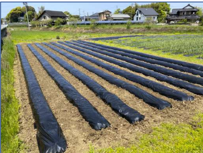
秋野菜用の畝立てを300m仕上げました！