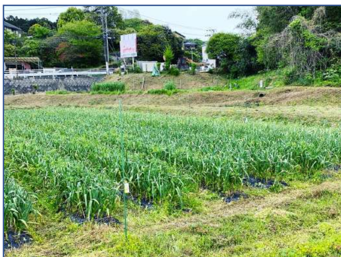
こんなに大きくなりました！