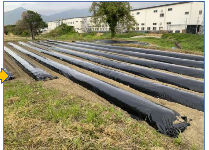
畝立てマルチ張り完了