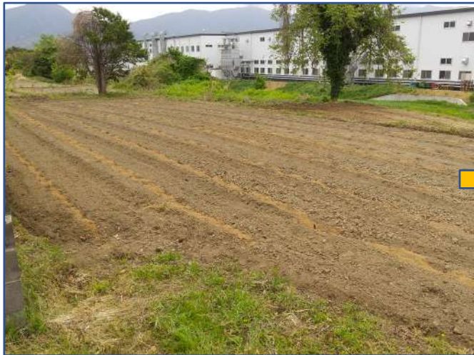
土壌改良材の散布