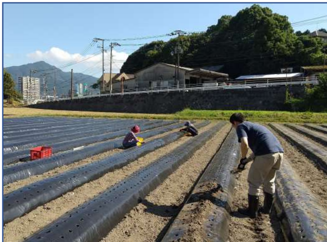
農友さんも応援に来てくれて皆で植付け！