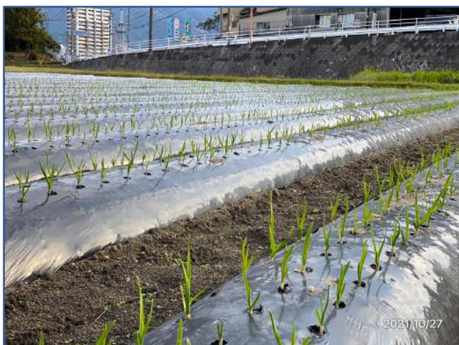
10.27 にんにくの芽が出揃いました！