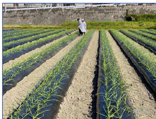
バイオを散布し微生物の活性化を促します！