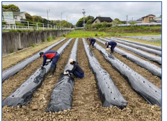
741粒の落花生を植え付けました！