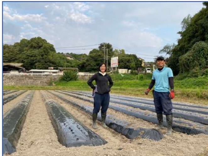
約8,000個のニンニク植付け完了！