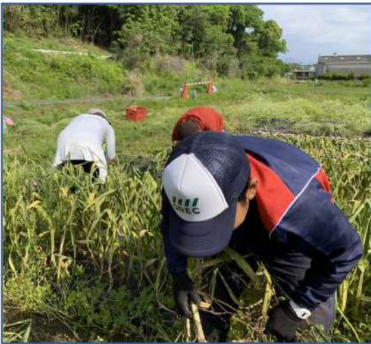
農友さんとにんにくの収穫