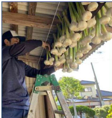
にんにくを干して乾燥させます