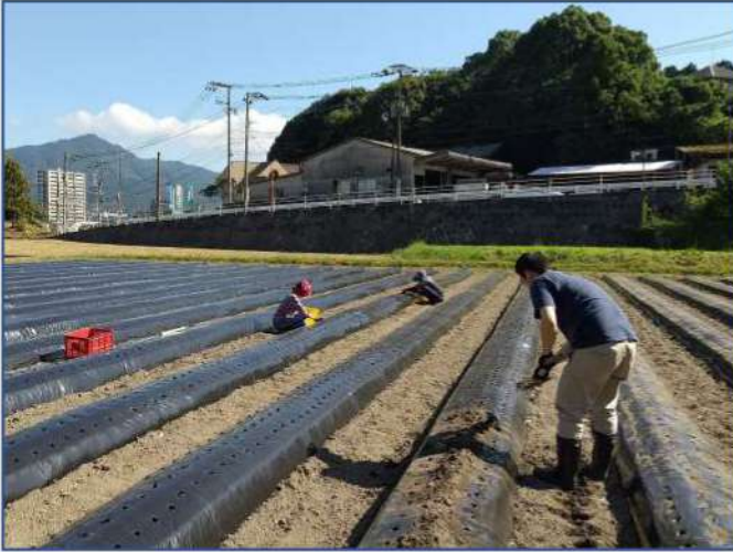
約8,000個のにんにくを農友さんと植えつけ