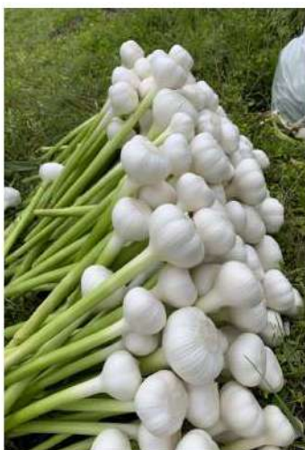
綺麗なにんにくができました！