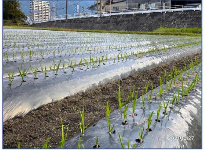
10.27 にんにくの芽が出揃いました！