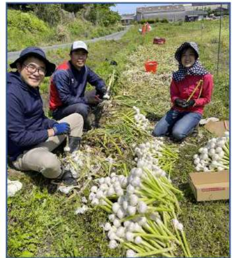
一つ一つ丁寧ににんにくの皮むき