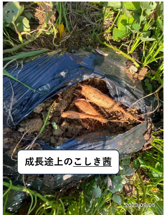
成長途上のこしき茜