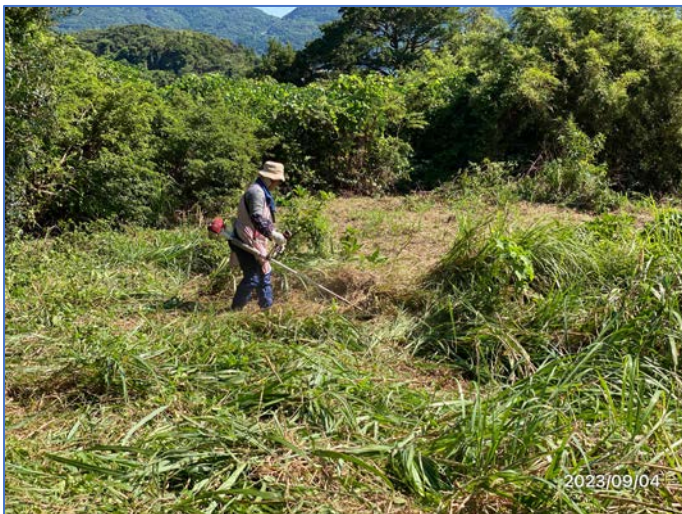
大先輩の奥さんも来島 9/3~5