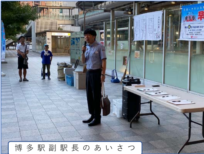
博多駅副駅長のあいさつ