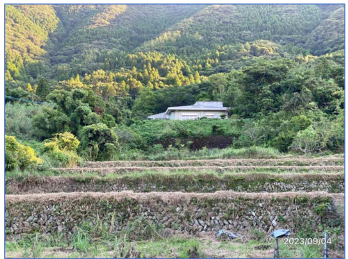
残すは6段目のみ建物がはっきり

南九州市頰娃町のサツマイモ栽培農家の大先輩A夫妻とは、約二十年前鹿児島県農業大学校の研修で出会って以来の親交です。農大では蒲生の大楠農産の仲間たちと大いに甑島の夢を語り合いました。