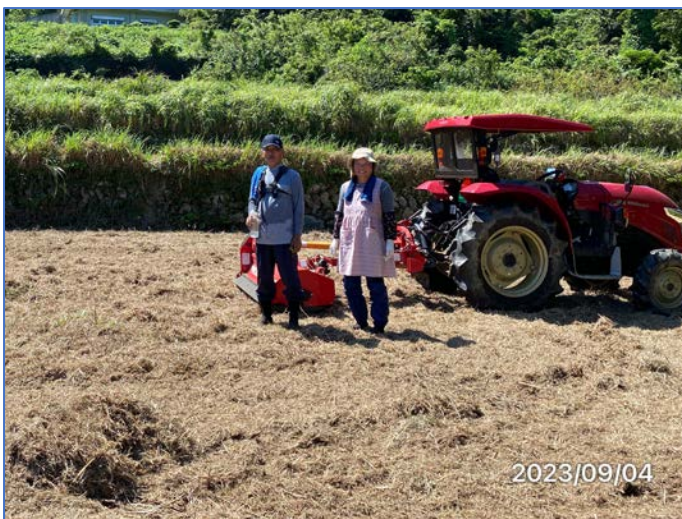
仲睦まじい大先輩夫妻