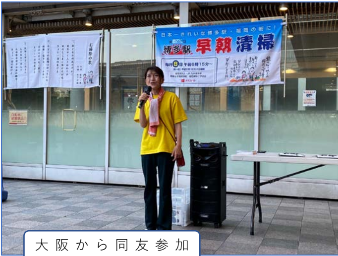
大阪から同友参加