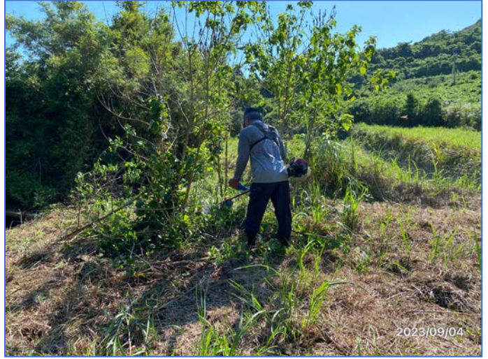
頰娃町から大先輩の応援 9/3~5