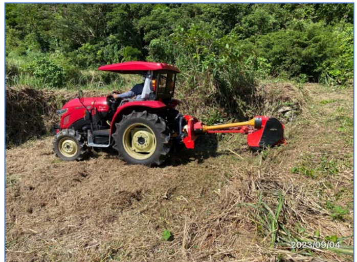
大先輩の活躍で四段目から五段目へ